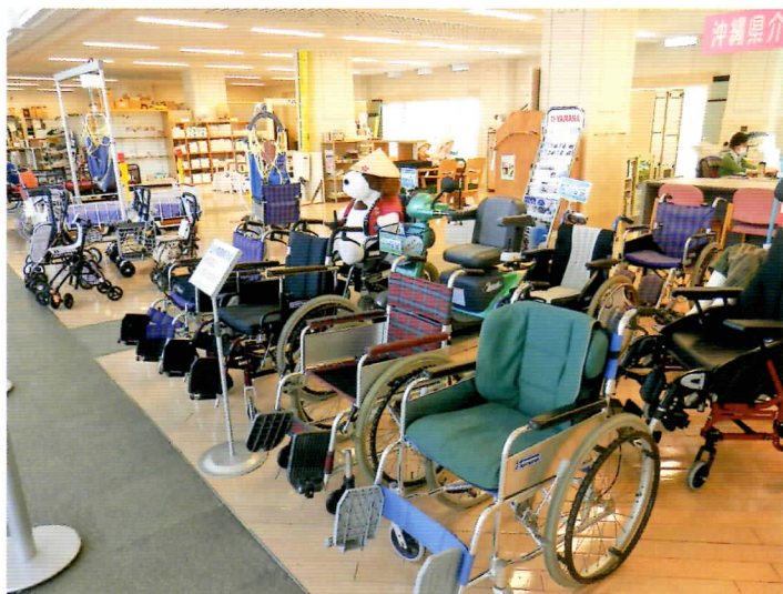
展示品は、沖縄県福祉用具事業者協議会の提供、ご協力によるものです

高齢者や障がい者の在宅生活に必要な用具や介護者の負担を軽減する用具などを幅広く展示、紹介しています。また、福祉用具、介護方法に関する相談を専門の相談員がお受けします。